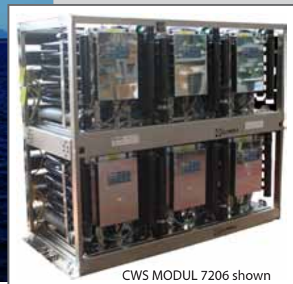
CWS MODUL 7206 shown